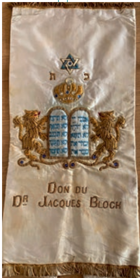
Manteau de Thorah

La quête d'identité à travers la recherche de ses racines devient une priorité existentielle. Se savoir appartenir à un groupe social et historique, nous confère une forme de confiance en soi, de stabilité psychique indispensable pour affronter l'avenir avec sérénité.