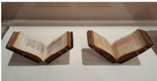
Manuscrit 593 (à gauche) et manuscrit Duran (à droite) (IMA - exposition sur les Juifs d'Orient)

Le manuscrit 593 de la BNF, du 14 e ou 15 e siècle, est identique dans son contenu au manuscrit Duran. Décoré à la feuille d'argent, il peut être une copie du manuscrit Duran qui lui est décoré à la feuille d'or.