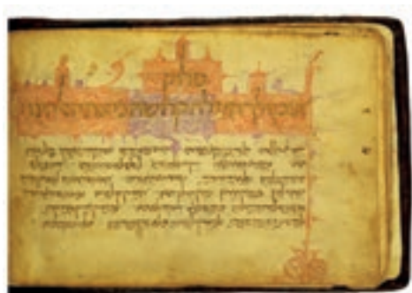
f°7v Piyyut de Juda Halévi 1 er jour de Roch Hachana