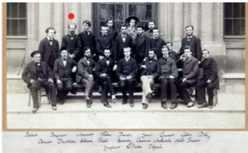
Panneau «France. Emile Durkheim». Réalisation : C. Lévy et L. Nedjar