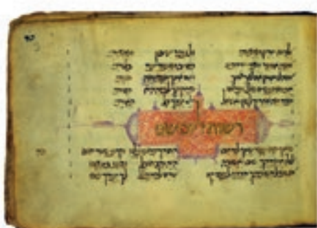
f°9r Piyyut de Salomon ibn Gabirol 2 e jour de Roch Hachana

Selon la tradition familiale, le manuscrit a été transmis de génération en génération à l'aîné des garçons depuis le 14 e siècle. Il a été utilisé pendant plusieurs siècles à Alger, comme le montrent les instructions de lectures écrites en marge par des personnes différentes pour suivre l'évolution du rituel. Le manuscrit a continué à être transmis de façon symbolique alors qu'il n'était plus en état d'être utilisé comme livre de prières, jusqu'à la dernière génération restée à Alger. Il a été retrouvé à Perpignan en 1993 chez Alfred Durand dans une valise non ouverte depuis le départ d'Alger 30 ans plus tôt. La famille Durand l'a donné au MAHJ en 2002.