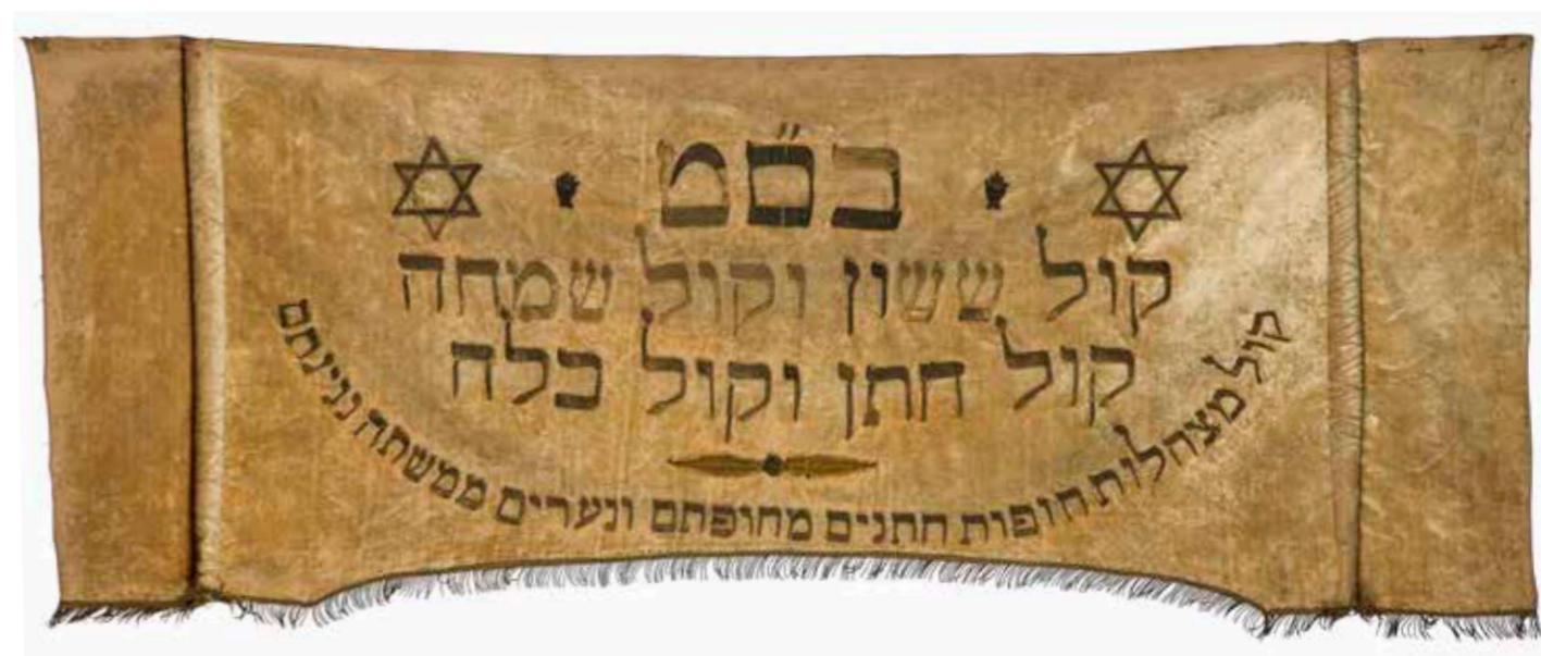
תמונה 38 וילון עיטורי קצר לכסא החתן {JMT. BI. 3. 2014}

כובד כשהוא ישוב על כיסא מיוחד שקושט באמצעות וילון קצר. דוגמה לוילון כזה נמצאת באוסף הטקסטיל של איזמיר (תמ' 38). הכתובת שרקומה במרכזו היא טקסט השיר המושר על פי המנהג בטקס הנישואין: 'קול ששון וקול שמחה, קול חתן וקול כלה. קול מצהלות חתנים מחופתם ונערים ממשחת נגינתם' (ירמיהו לג: יא).