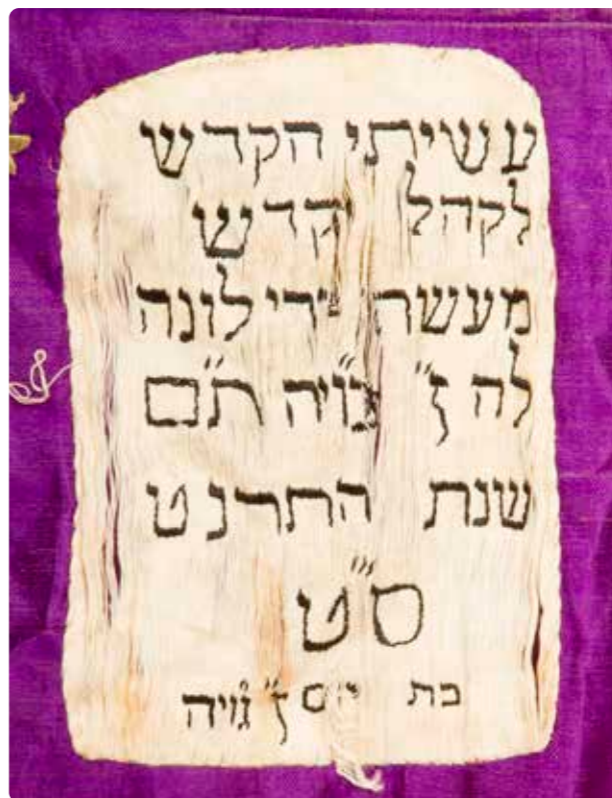
תמונה 34 מעיל לספר תורה, סטין משי וכותנה, 1898/9 (כתובת 102)

[ב]ן ג'ויה'. ניסוח פשוט ויוצא הדופן זה, בגוף ראשון, מצביע על כך שלונה הכינה את המעיל לספר התורה במו ידה.