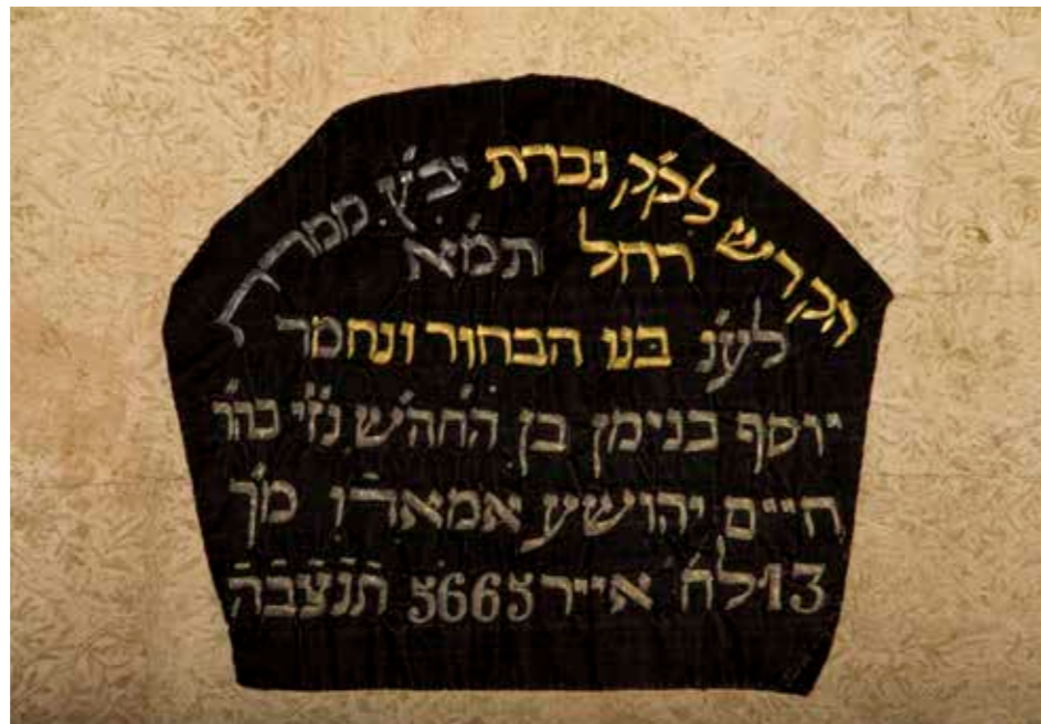
תמונה 45 כתובת הקדשה, כיסוי קטן לספר תורה, 1905 (כתובת 48)