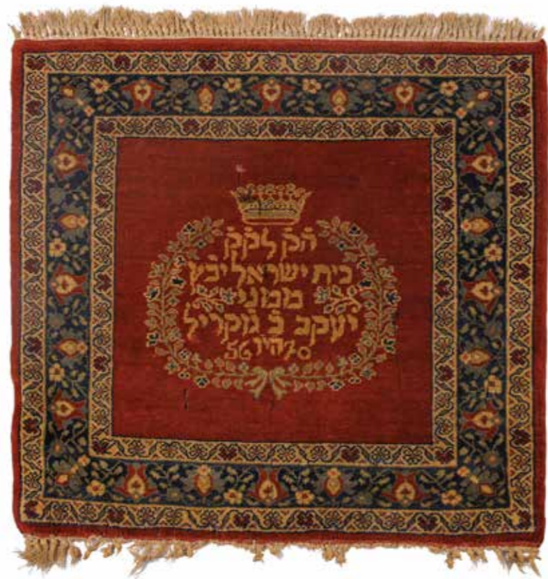
תמונה 11 כיסוי תיבה, שטיח קשרים מצמר, 1909/10 (כתובת 24)