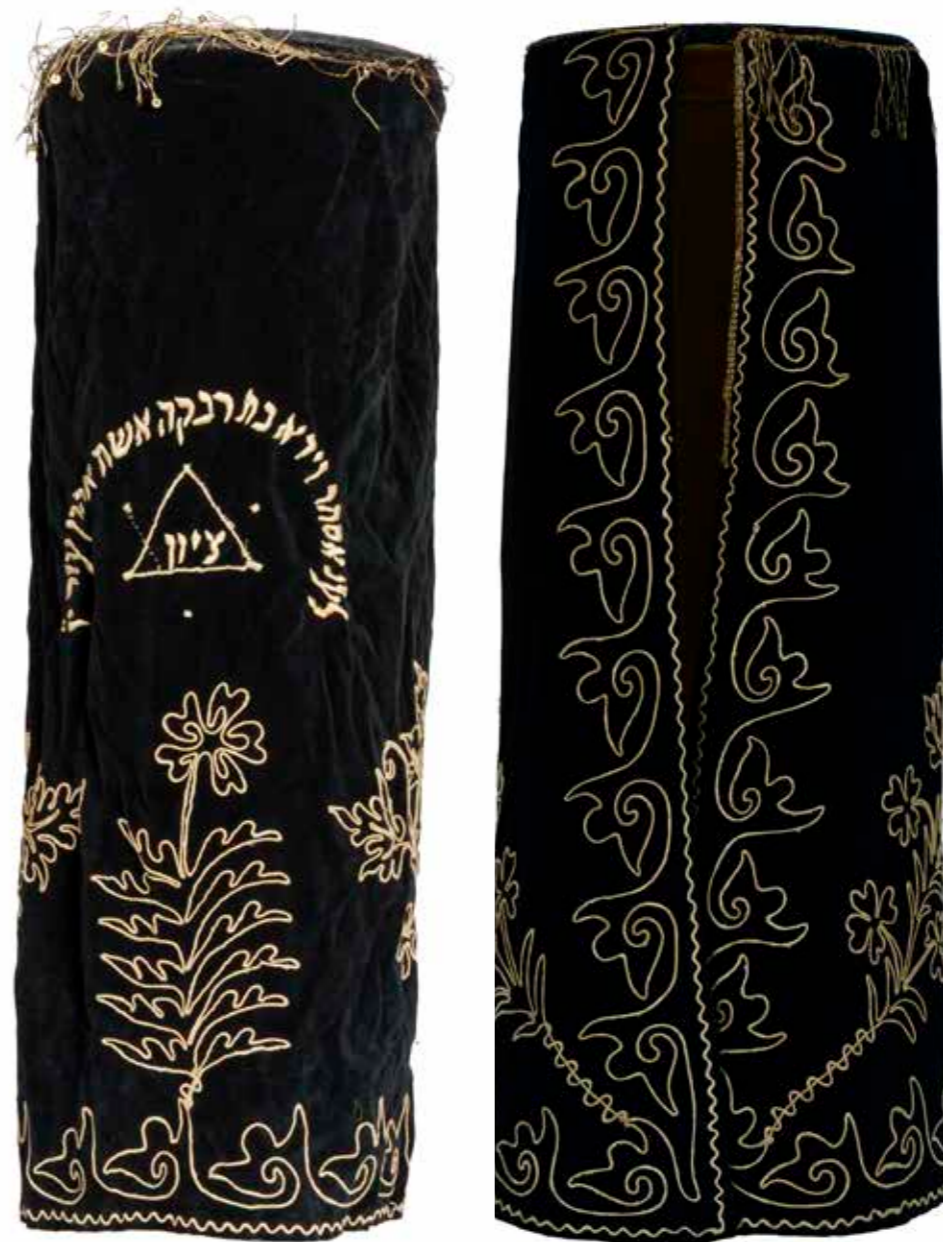
תמונה 10 מעיל לספר תורה, חזית וגב, קטיפת כותנה, רקמת מכונה (כתובת 115)