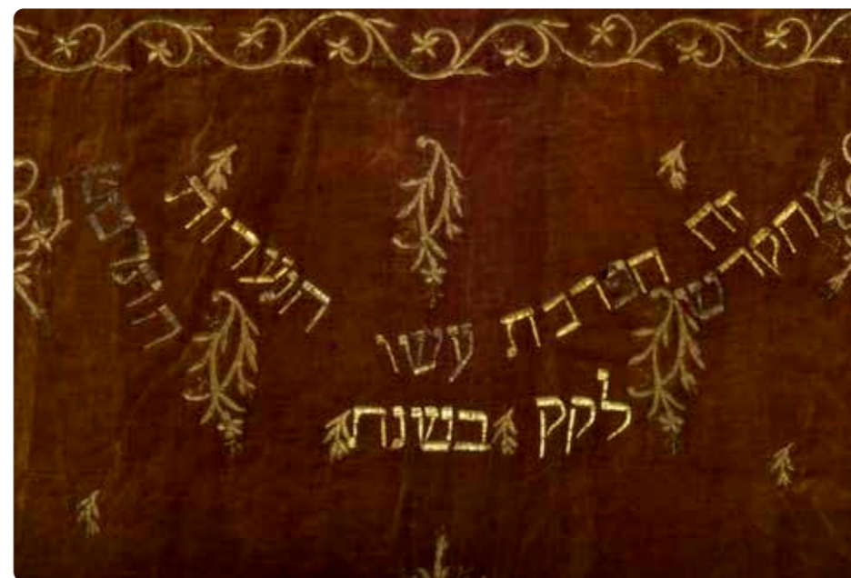
תמונה 36 כתובת הקדשה, פרוכת, 1908/9 (כתובת 121)

גם רוקמים מוכשרים פחות תרמו תשמישי קדושה לבתי הכנסת. דוגמה לכך היא עבודתה של הנערה לונה שהוזכרה לעיל, אשר תרמה את מעיל ספר התורה בשנת 1898/9 (תמ' 34). דוגמה אחרת לעבודה של נשים בלתי מקצועיות אך שוחרות רצון טוב היא הפרוכת שנעשתה על ידי כמה נערות בשנת 1908/9 (תמ', 36 כתו' 121). על חוסר ניסיון מעידה גם הכתובת שממנה הושמט שם בית הכנסת: 'זה הפרכת עשו הנערות הקדש לק"ק (קהל קדוש) בשנת התרס"ט'. השילוב המגושם של הכתובת בין דגמי הפרחים היא הוכחה נוספת לניסיון מזערי בעבודה מסוג זה. תרומה לבית כנסת של תשמישי קדושה על ידי קבוצת נערות עשויה לבטא מעין משאלה משותפת, אולי לשידוך ולנישואין.