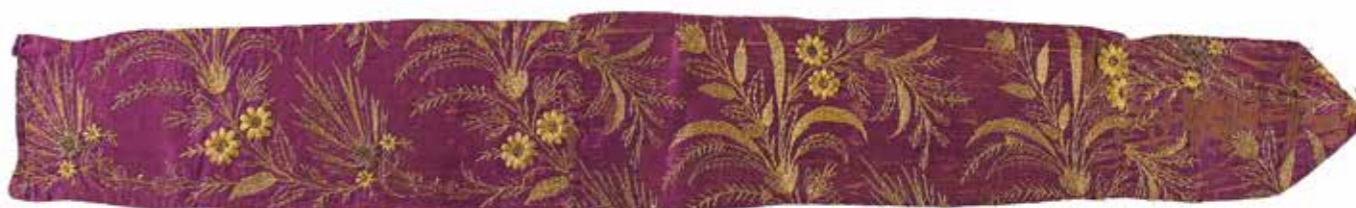
תמונה 7 (למטה) אבנט לספר תורה, סטין משי, ראשית המאה העשרים {IJM.T. 39. 2013}

הנראים בתמונות 8, 9 נעשו בידיים מיומנות יותר. מעידים על כך החיתוך הישר של האריג, הגימור העדין של השוליים ורקמת המכונה על הקטיפה הסגולה עם התאריך העברי המצוין במספרים רקומים. אלו בוצעו כנראה בידי חייט או תופרת.