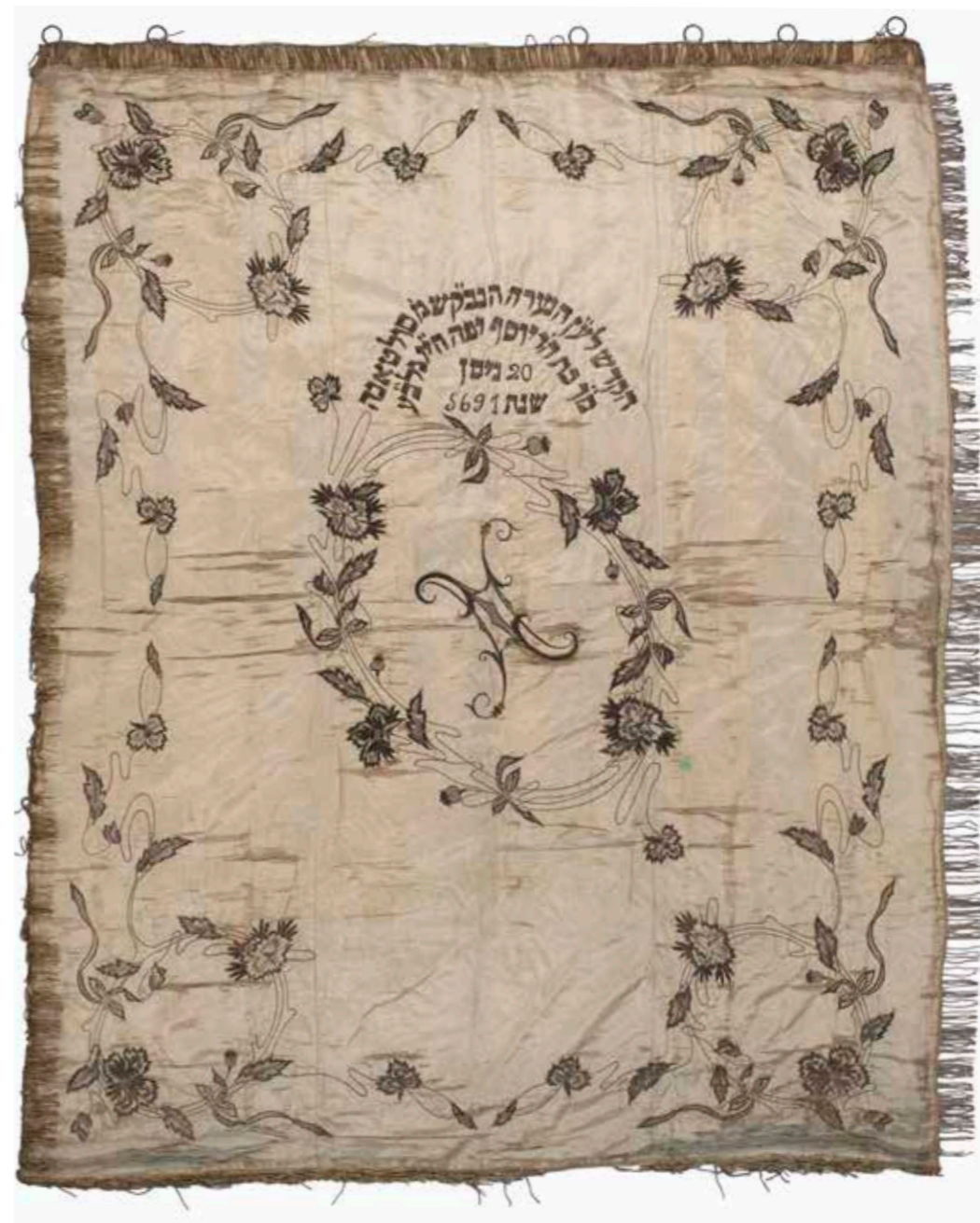
תמונה 19 רקמת מכונה על קטיפת משי, פרוכת, 1931 (כתובת 132)

רבים מן הפריטים שנתרמו לבתי הכנסת מעידים על חדירתם של סגנונות, טכניקות, חוטים ודגמים אירופיים לרקמה ביתית ומקצועית. ניכר בהם שימוש בתכים שטוחים או תבליטיים, וכולם יחד יוצרים רושם נטורליסטי צבעוני (תמ' 20, 21). דגמים חדשים הופצו על ידי כתבי