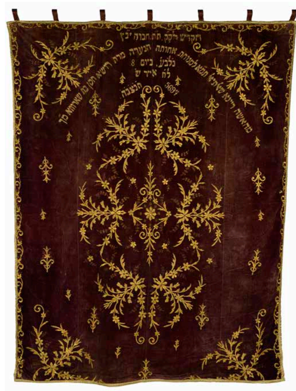
תמונה 44 כתובת הקדשה, פרוכת, קטיפת כותנה, 1937 (כתובת 93)

בקרב השמות הפרטיים של נשים יש מגוון נרחב. רק מעטים מהם הם שמות עבריים כמו שרה, ראשונת האמהות, ואסתר – הגיבורה התנ"כית. שני השמות הללו מופיעים גם בהטיות: שרה הופכת שארותא או סארינה, ואסתר נהיית לאסתרולה. רוב השמות מביעים אור, יופי, שמחה, אצילות, כבוד, חיים ומזל טוב. מקורם של שמות אחדים בספרדית: 'לונה' שפירושו ירח חוזר ונשנה בעשר כתובות. השם 'וידא', שפירושו חיים, נוסף לאישה למען תלד בשלום,