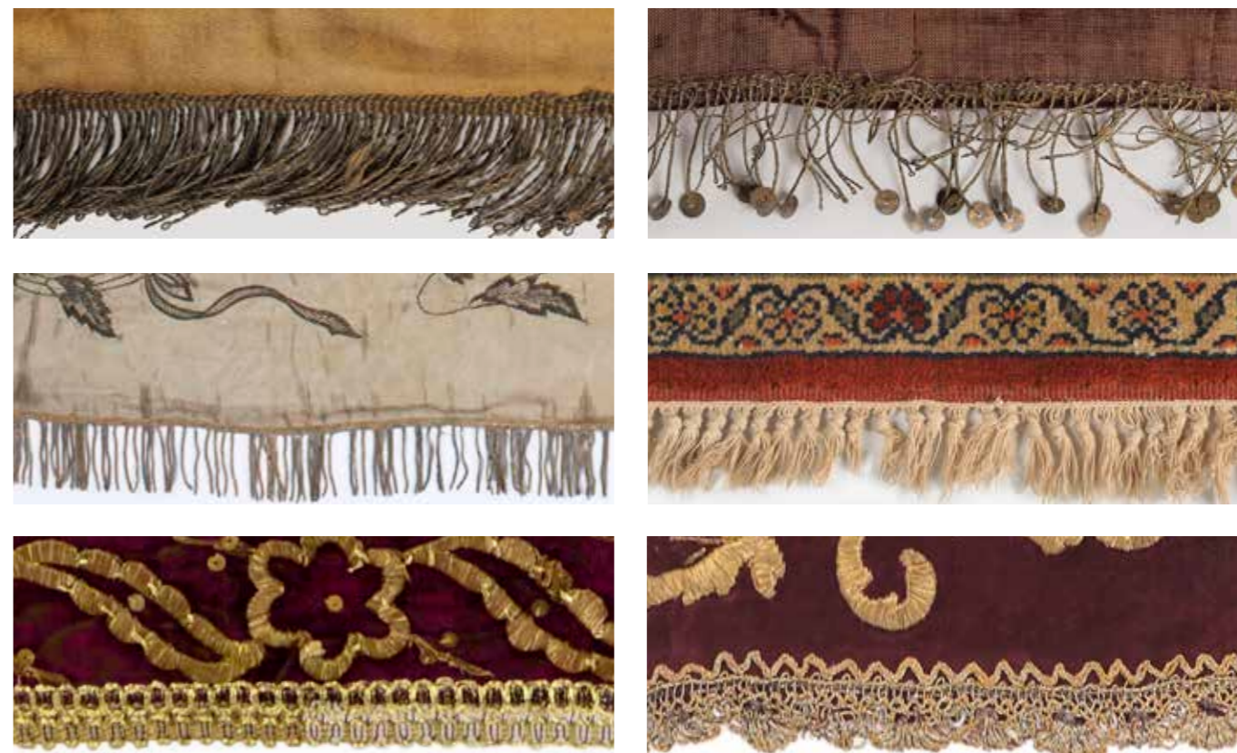
תמונה 15 סרטי עיטור וגימור

מכיוון שהמרכיב הראשון שאותו יש לשקול הוא החומר, אך טבעי הוא שיש לבחור בבד יוקרתי מהודר, כפי שאנו אכן רואים בתשמישי הקדושה שנידונו. רובם עשויים מאריגי משי שונים, הארוגים בטכניקות היוקרתיות ביותר: קטיפה, ברוקד, דמשק וסטין. מרביתם של אריגים אלו מעוטרים ברקמת זהב או רקמת משי. באשר לצבע ולעיצוב, הרי יש מגוון עשיר של צבעים ודגמים מסוגננים, בין אם ארוגים, רקומים או עשויים בעבודת טלאים (אפליקציה). למרות זאת, ישנם בין תשמישי הקדושה גם בדים צנועים, כמו כותנה חדגונית או מדוגמת, או מוצרים אחרים