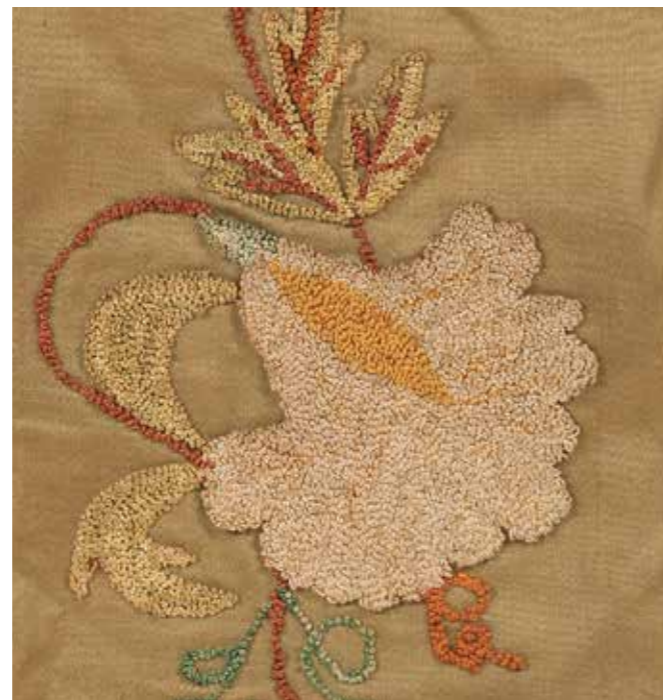
תמונה 20 (ימין) אריג משי סטין עם רקמת יד במגוון תכים, מעיל לספר תורה {J.M.T.BH. 27. 2014}