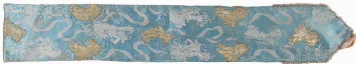
תמונה 6 (למעלה) אבנט לספר תורה, סטין משי, ראשית המאה העשרים {IJM.T. 36. 2013}