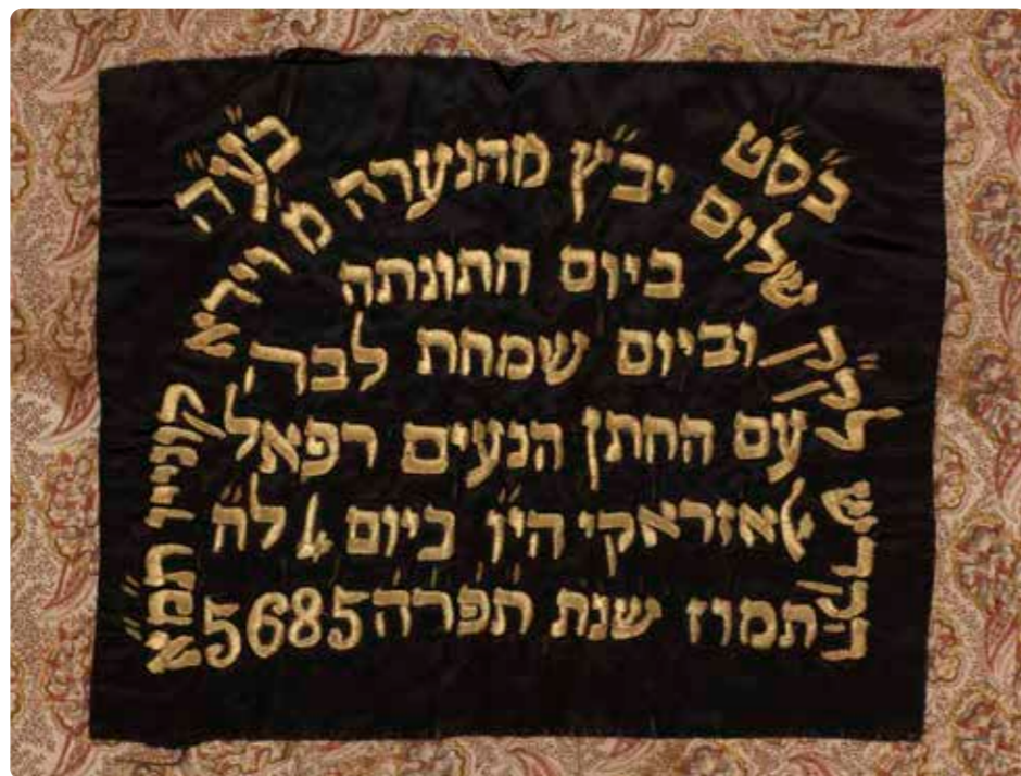
תמונה 37 כתובת הקדשה, פרוכת, 1925 (כתובת 80)

בת מזל הייתה וידא קוניו שתרמה בשנת 1925 פרוכת לבית הכנסת 'שלום' כדי לחגוג את נישואיה (תמ' 37, כתו' 80). בכתובת ההקדשה שלה נאמר: 'בס"ט (בסימן טוב) בע"ה (בעזרת ה') הקדש לק"ק (לקהל קדוש) שלום יב"ץ (יכוננו בצדק) מהנערה מ[רת] וידא קוניו תמ"א (תבורך מנשים אמן) ביום חתונתה וביום שמחת לבה עם החתן הנעים רפאל אלאזראקי הי"ו (ה' ישמרהו ויחיהו) ביום 4 לח[ודש] תמוז שנת תפר"ה 5685'. הברכה הצפונה בכתיבת תאריך התרומה הולמת את האירוע: שנת 'תפרה' רומזת לשנה פורייה.